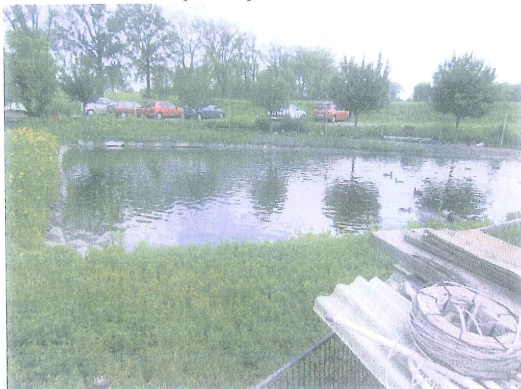
pozemek parc.č. 2952/10