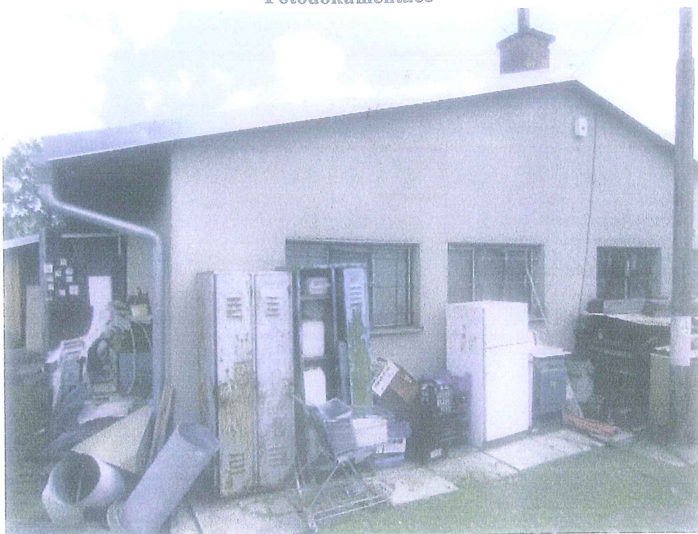
pozemek parc.č. 2951/1