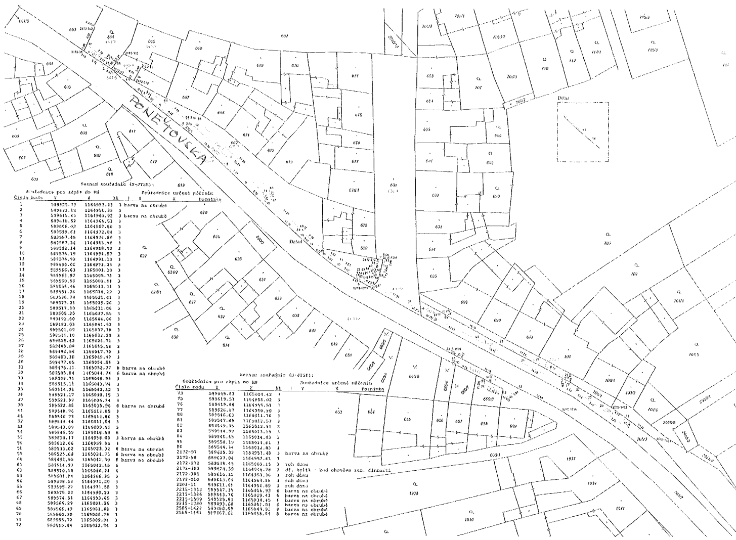
Seznam zastavěných (S-Z) : Dostavěnice pro zápis do KN Dostavěnice určené přístřeškům číslo bodu X Y X Y Poznámka